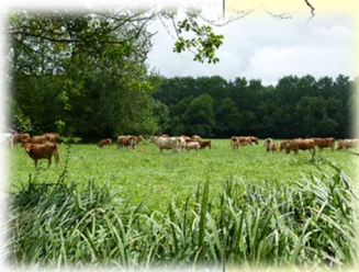
Prairie humide pâturée